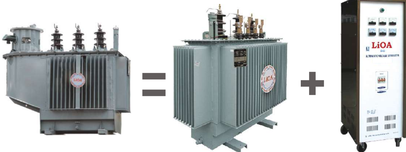
MÁY BIẾN ÁP ĐIỆN LỰC TỰ ĐỘNG ỔN ÁP